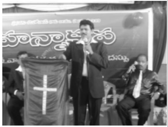
ఎడిటర్ - నతానియేల్ ఆర్ .కొడవటికంటి గారు