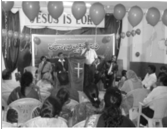
ఫీఫ్ ఎడిటర్ - కొడవటికంటి గారు